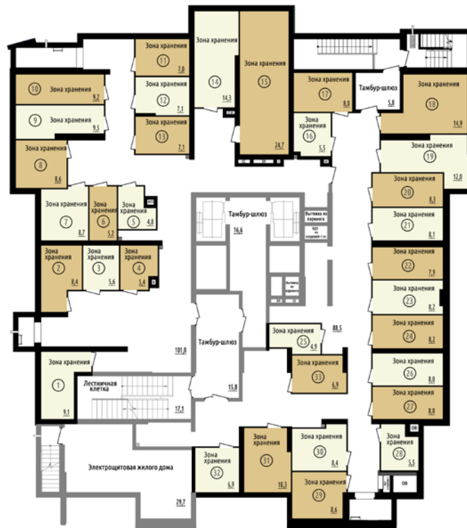
план - 1 этажа